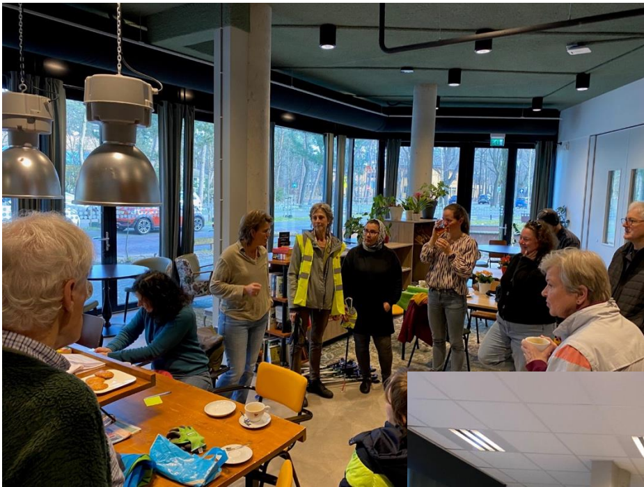
Landelijke Opschoondag maart 2024