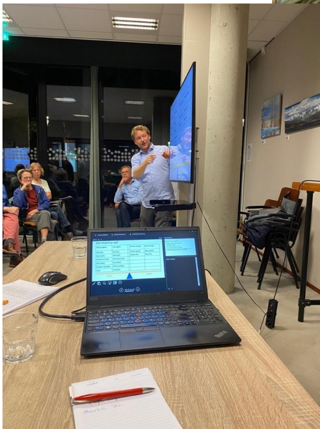
Bijeenkomst over warmtepompen oktober 2023