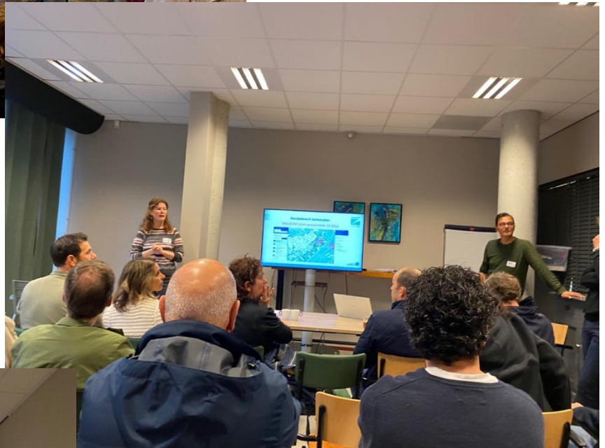
Bijeenkomst herziening bestemmingsplan 2023